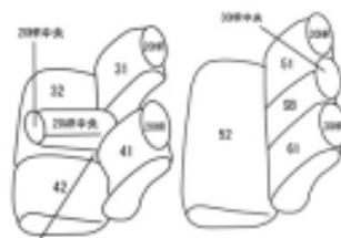
20年中央 20年中央 20年中央