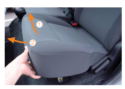
5 座面の前側を持ち上げてから、全体を前に 引くと座面が外れます。 座面を取り外す際、車体等に傷を付けない ようご注意ください。