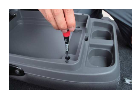
1 中央席背もたれを倒し、バックテーブルを 外します。バックテーブルのフタを開け、 ニヶ所のネジを外します。