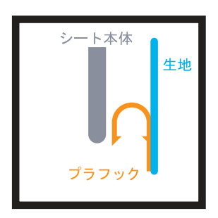
7 ここからは、分かり易いようにイラストで 説明します。