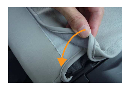
8 15ページの6で引き出した生地をカバー 背面下の生地とマジックテープで固定しま す。