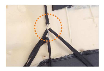
9 前後のゴムを固定します。 ゴムが緩い場合は結ぶ等、長さを調整して下さい。