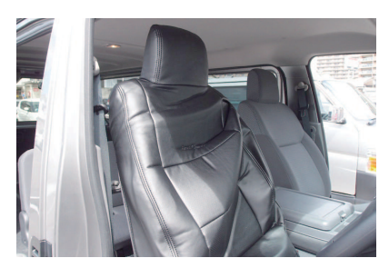
2 シートのラインに合わせてカバーをかぶせます。 ヘッドレストと肩口をしっかり入れ込みます。