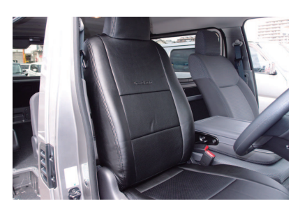
タ カバーのラインを整えて、1列目運転席側 背もたれの完成です。 助手席側も同様に取り付けます。