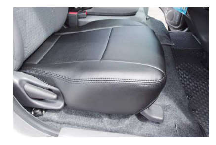
15 カバーのラインを整えて、1列目運転席側 座面の完成です。