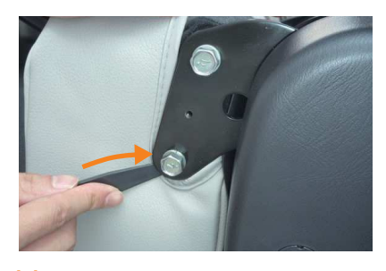
11 プラスチックカバーを外し、ヘラなどを使 用し生地を入れ込みます。