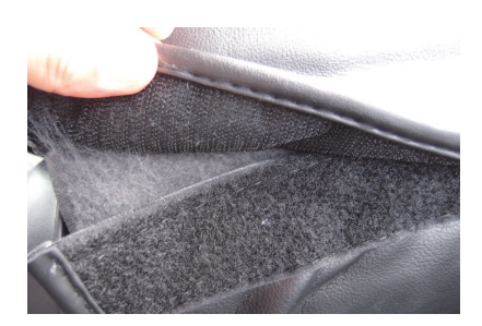
7 引き出した生地とカバー背面下のマジック テープを固定します。