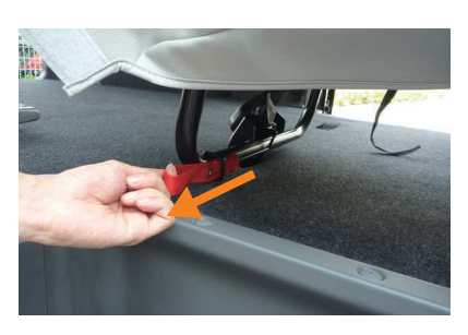
5 背もたれを前に倒し、座面後方下に付いて いるベルトを手前に引き、ロックを解除し ます。