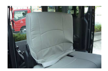
3 シートのラインに合わせてカバーをかぶせ、 1 列目背もたれと同様にシートに密着させ るようにして、シワをなくしていきます。