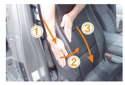
3 カバー側面の生地を、図の1~3の順番で シートに密着させるようにして、シワをな くしていきます。側面の生地がしっかりと 張るまで繰り返し行って下さい。