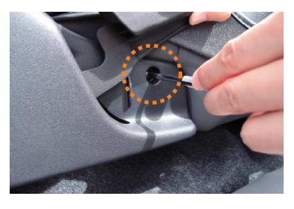
5 リクライニングレバーを上に持ち上げると 図の丸印の位置にネジがあります。 プラスドライバー使用してネジを緩めます。 カバー側面の生地をシートとプラスチック 部の隙間に入れ込み、ネジを締めます。