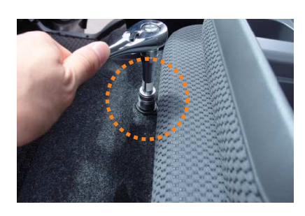
2 キャップを外すとボルトがあります。 ソケットレンチ等を使用してボルトを外します。