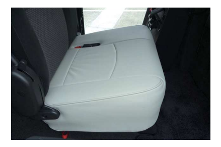
18 カバーのラインを整えて、2列目運転席側 座面の完成です。 助手席側も同様に取り付けます。