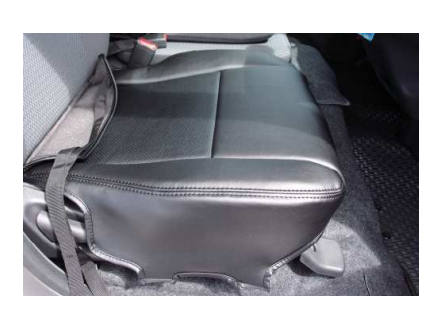
2 シートのラインからずれないように、カバ ーをシート全体にかぶせます。