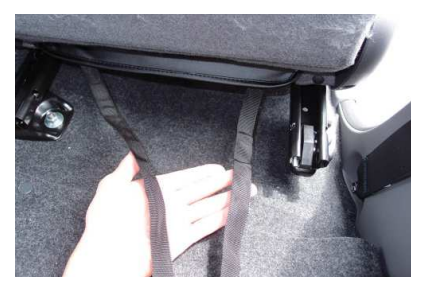
11 カバーの後ろ側に付いているベルトを座面の下を通し前方へ入れ込みます。 ベルトを座面の下に通す際はシートを一番前にスライドさせ、座面の下に入れ込みます。