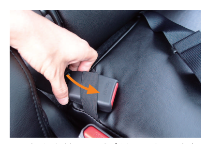
13 カバーに付いているゴムにシートベルトを 通します。