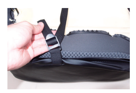
前後のベルトを固定します。 強く引き過ぎるとベルトが切れる恐れがあ りますのでご注意下さい。