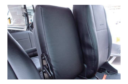
6 取り外した逆の手順で、バックテーブルを 元に戻します。この際、ネジ穴が生地で隠 れていますが、生地ごとネジを締めて下さい。カバーのラインを整えて、1列目中央 席背もたれの完成です。