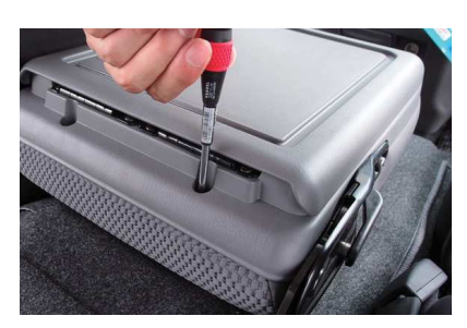
2 バックテーブル後方にもネジが2ヶ所ありますので、外します。 4ヶ所のネジを外す事で、バックテーブルが取り外せます。