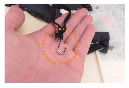
8 カバーの前後に付いているゴムに、付属の S字フックを取り付けます。