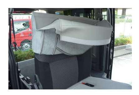
2 あらかじめカバーを半分程折り返しておき、 カバーをシートにかぶせます。