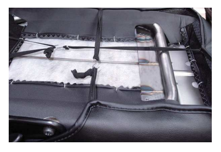
5 カバーに付いているゴムを、図のようにS 字フックで固定します。生地同士が引っ張 り合うようにゴムの長さを調整して下さい。