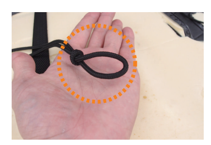
11 カバーに付いているヒモを固定します。 始めに片側で輪を作ります。