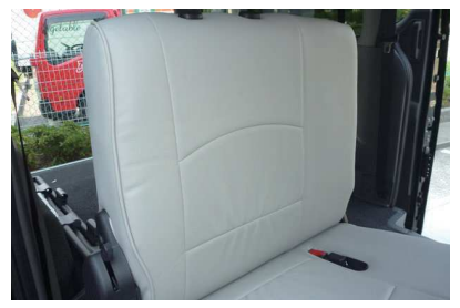
10 カバーのラインを整えて、2列目運転席側 背もたれの完成です。 助手席側も同様に取り付けます。