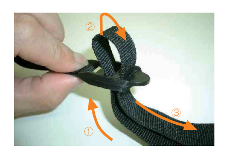
13 ベルトの通し方は、図の①~③の順番にベルトをバックルに通し、引く事でベルトが締まり固定されます。 強く引き過ぎるとベルトが切れる恐れがありますのでご注意ください。