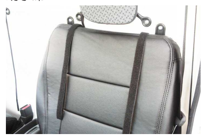
7 シートのラインに合わせてカバーをかぶせ ます。