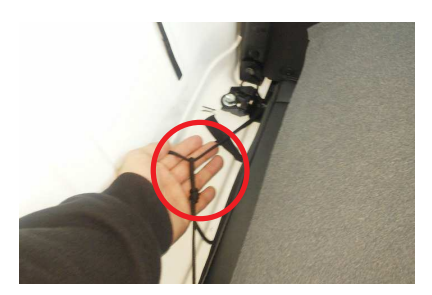
3 背もたれを倒し、カバーの左右に付いているヒモを座面背面下部で結び固定します。 ※ヒモの結び方は10ページを参照