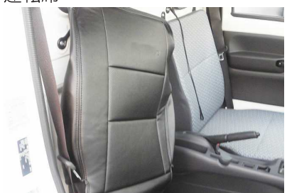
カバー側面に付いているファスナーを開い た状態で、シートのラインに合わせカバー をかぶせます。