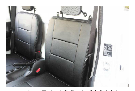
10 カバーのラインを整え、助手席背もたれの 完成です。