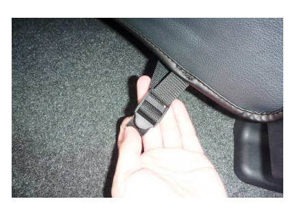
2 バックルにベルトを通し、引き絞る事で、 カバーが固定されます。