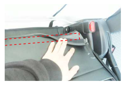
3 引き出した生地と背もたれ背面下部の生地 を、マジックテープ同士で固定します。