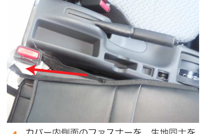
カバー内側面のファスナーを、生地同士を 内に寄せながら閉じます。 ファスナーの先端は、カバーの内側に入れ 込みます。