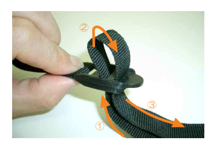
3 ベルトの通し方は、図の①~③の順番にベルトをバックルに通し、引く事でベルトが締まり固定されます。 強く引き過ぎるとベルトが切れる恐れがありますのでご注意下さい。