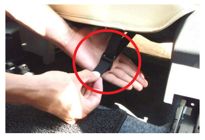
5 引き出したベルトを2番で入れ込んだ生地 に付いているバックルに通し固定します。 ※ベルトの固定方法は9ページを参照